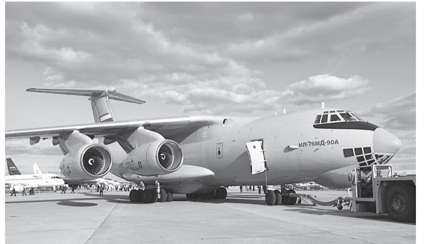
За счет Ил-76-МД-90А, переданного «Авиастаром» в мае заказчику, показатель «Производство прочих транспортных средств и оборудования» вырос на 33,1% к первому полугодью 2022 года.

В то же время ряд отраслей не достиг прошлогоднего уровня про-